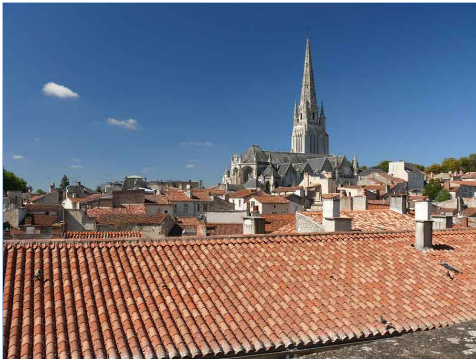
Fontenay-le-Comte : l'église Notre-Dame (15 ème siècle) vue depuis les fortifications du château médiéval (13 ème siècle).

Fontenay-le-Comte était une halte importante sur les chemins de Saint-Jacques au Moyen-âge. Au début du 16 ème siècle, l'église conservait encore « une chasse d'argent doré à cinq vitres, [contenant des] reliques de Monsieur saint Jacques ». Cette chasse disparut malheureusement en 1568, au moment du sac de la ville par les Huguenots.