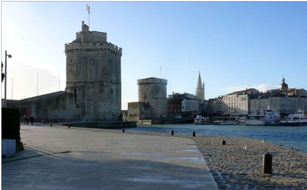
La Rochelle (de gauche à droite) : Tour Saint-Nicolas, Tour de la Chaîne et Tour de la Lanterne.