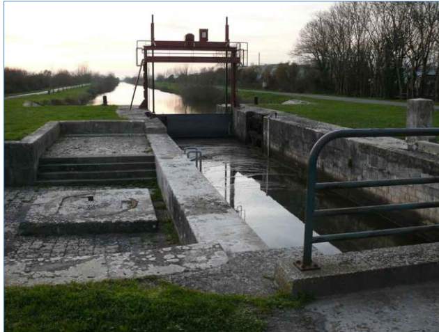
Marans : entrée Nord du Canal de La Rochelle à Marans.

5,2 kms – Passerelle métallique amovible (pour cycles et piétons) sur la Sèvre Niortaise: à droite du quai, après le dernier ponton. Ne pas l'emprunter, et continuer à avancer sur la rive gauche de la Sèvre. 50 mètres après avoir dépassé cette passerelle, l'entrée Nord du canal de La Rochelle à Marans apparaît sur la gauche.