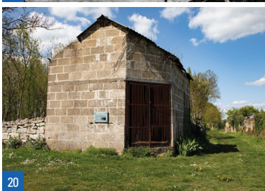
19a. Le pont de bois / 19b. Le pont de la Pajotière, 1908 / 20. L'abattoir

écailles, comme une grande partie des bâtiments de l'époque. Au XIX e siècle, il est recouvert d'une toiture en ardoise et des dépendances sont ajoutées. Pendant la Seconde Guerre mondiale, les Allemands s'installent à Nieul-sur-l'Autise et réquisitionnent notamment les granges et les écuries du Vignaud. Aujourd'hui, le château accueille un centre d'hébergement et de restauration pour les groupes et particuliers, au sein d'un parc communal de 4,5 hectares ouvert à tous.