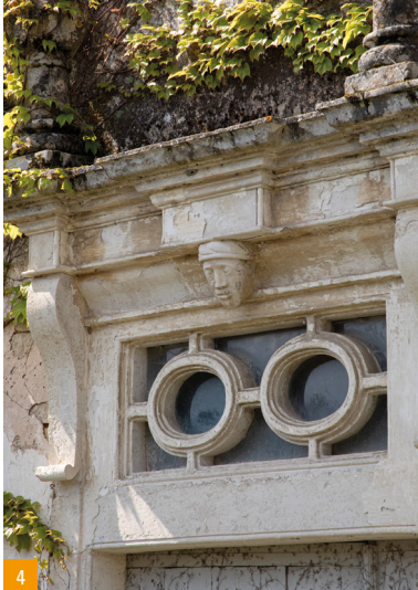
3. La corniche et les oculi sur la façade de l'aumônerie / 4. La porte du couvent Sainte-Geneviève

œuvrant toujours au sein de l'église Saint-Vincent. La partie située à droite a été acquise par la municipalité afin d'y accueillir l'espace périscolaire pour les élèves des deux écoles situées sur la commune.